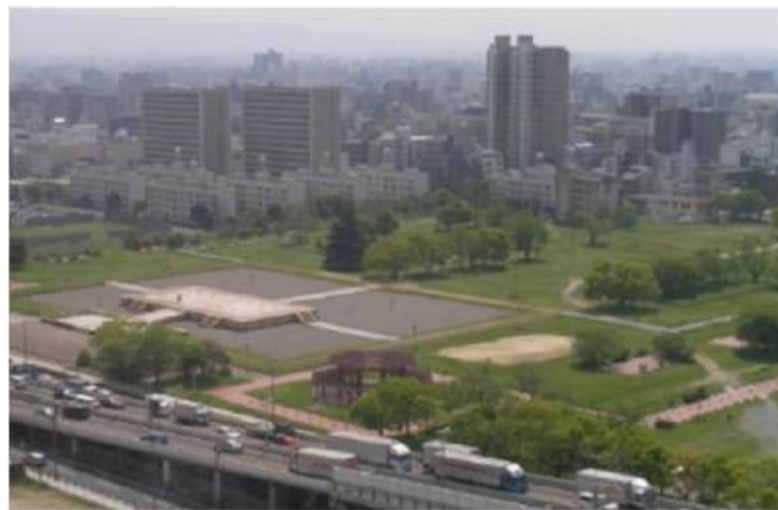
史跡難波宮跡 （大阪歴史博物館方面より臨む）