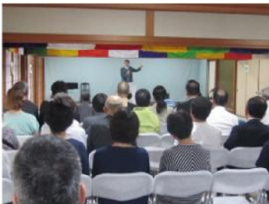
文学碑の集い(講演会)