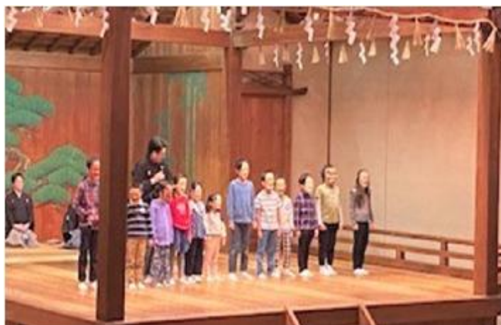
伝統芸能鑑賞会 「こどもとたのしむ能狂言」（能面体験コーナー）