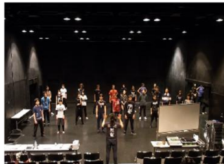
芸術創造館での活動風景 (大練習室でのパントマイム講座)