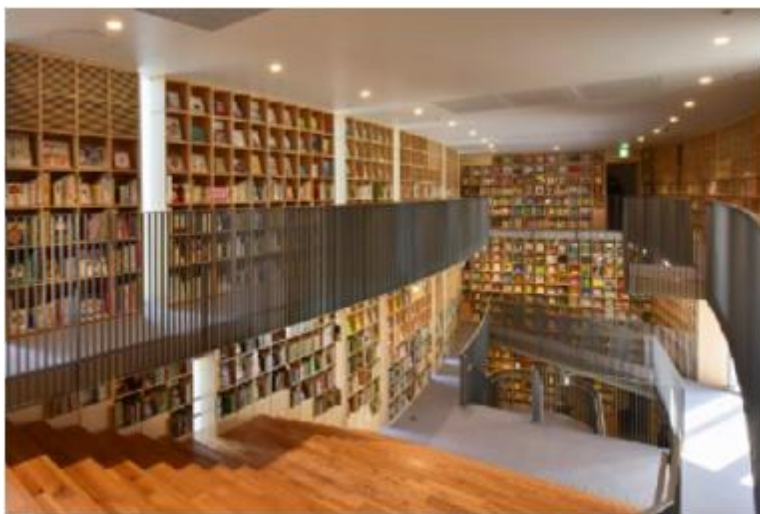
こども本の森中之島 (内部)