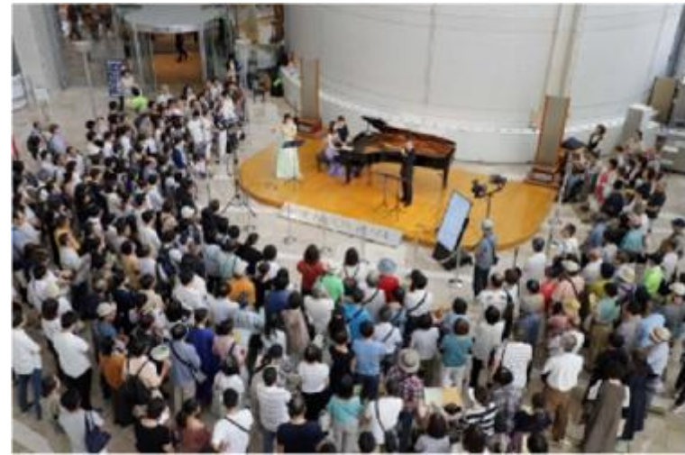
大阪クラシック (民間ビルのアトリウムでのコンサート)