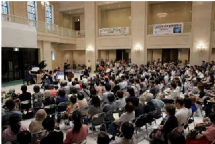
大阪クラシック (大阪市役所玄関ホールでのコンサート)