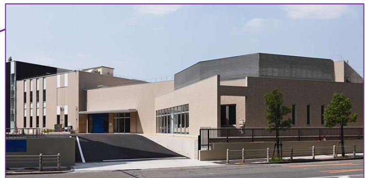
<津波・高潮ステーション>