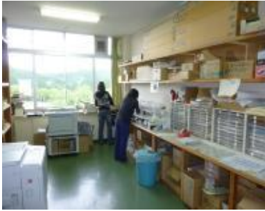
小学校で子ども安全サポート全体会 (登録約300人)のための資料印刷