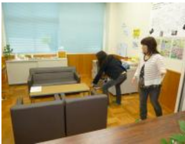
中学校での活動拠点の訪問を迎えて くれるコーディネーターのお二人 の手紙)