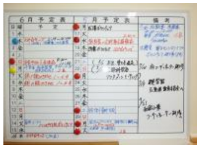
予定表で活動予定を把握・共有