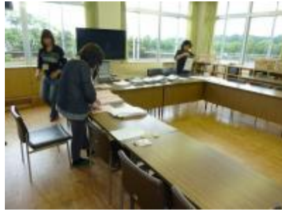
子ども安全サポート全体会のための 資料綴じ作業