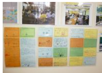
壁に掲示されたメッセージカード (子どもからの活動へのお礼