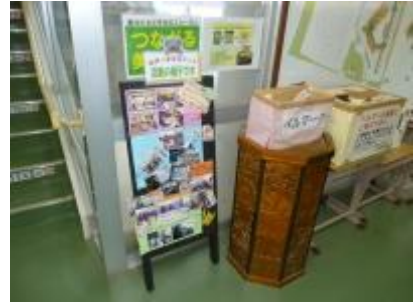
校内に学校支援活動の様子を 掲示 (小学校)