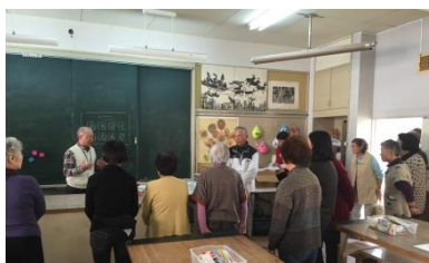
<事前打ち合わせの様子>