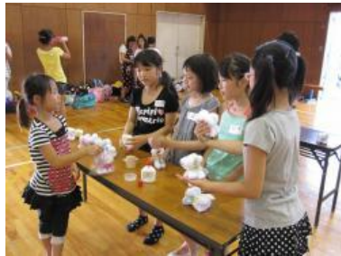
見守り隊の方への プレゼントを作成