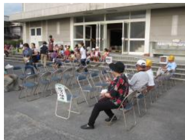
肩のみみ肩たたきをするための席も準備