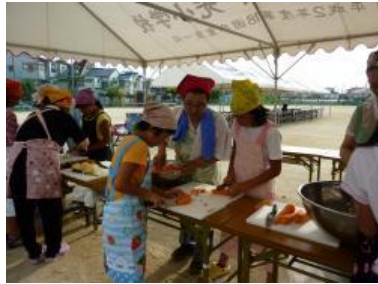
夕食の準備（運動場）