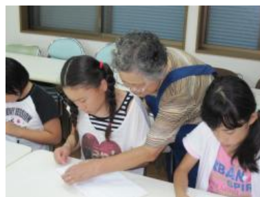
地域の方の支援を受けながら 雑巾を縫う