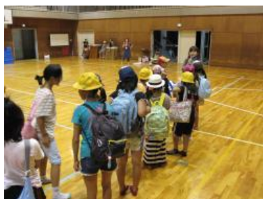
第1部終了後、通学合宿へ出発