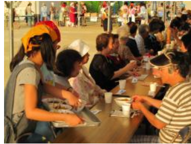
見守り隊の方へ夕食を配膳する（運動場）