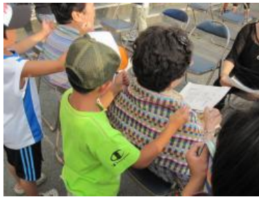
見守り隊の方の肩をほぐす