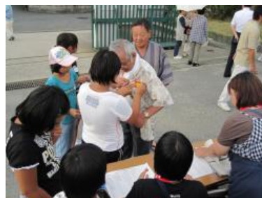
受付の際に見守り隊の方々に 児童が感謝バッジを付ける