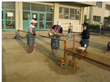
そうめん流し台は地域の方の手作り