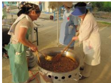
大鍋やガスバーナーは地域からの提供