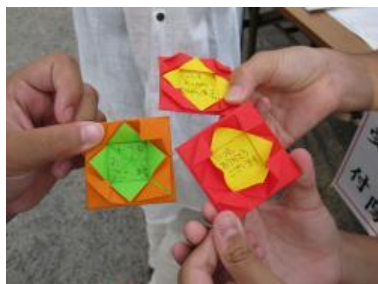
見守り隊の方への感謝バッジ