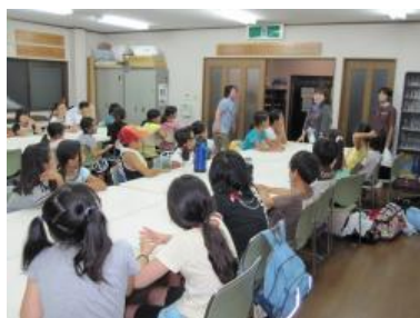
地域の方から予定等について 説明を聞く