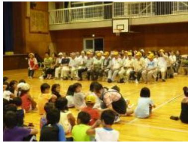
見守り隊の方に感謝を伝える 集会の様子（体育館）