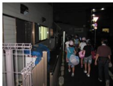
通学合宿の宿泊先公民館に到着