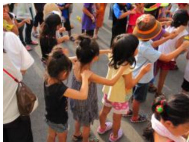
見守り隊の方の肩のみみ方たたき方を みんなで練習