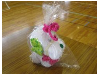
完成したプレゼント タオル犬