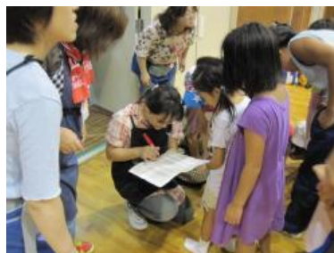
第1部終了後の確認