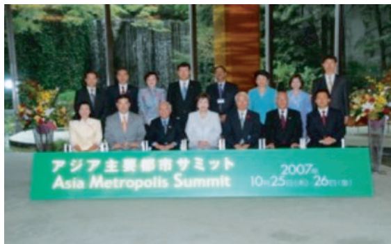
図-50 アジア主要都市サミット