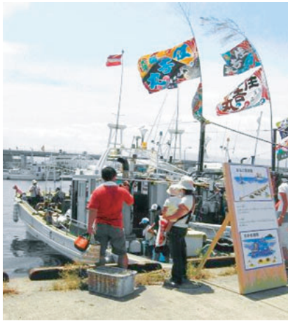
図一49 魚庭の海づくり大会（漁船見学）