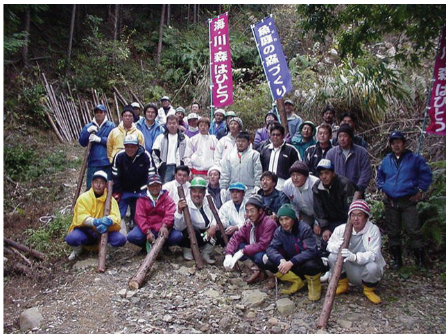
図-43 魚庭（なにわ）の森づくり事業