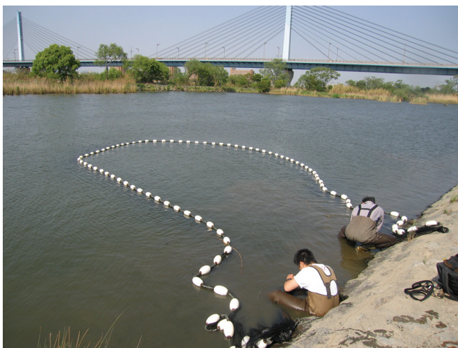
図-41 現地調査の様子（淀川城北ワンド）

淀川の本流及びワンド 145 地点で生息調査を実施し、魚類 34 種、水生植物 27 種が確認されるとともに、外来魚のブルーギル、オオクチバス、外来植物のオオカナダモ、ボタンウキクサ等の出現割合が高くなっていることが判明しました。