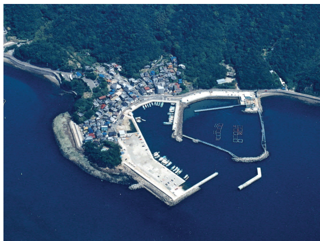
図-44 小島漁港航空写真

府民と漁業者との交流を促進する拠点の整備を目的に、深日漁港においては、親水機能をもたせた階段護岸の一部整備を行い、小島漁港においては、多目的広場等の基盤整備となる埋立等を行ないました。