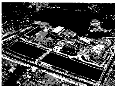
平成9年度 大阪まちなみ賞〔大阪府知事賞〕 泉佐野市総合文化センター