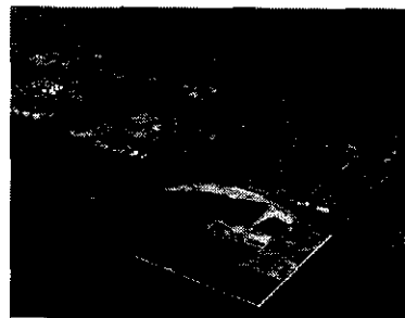
<フェニックス泉大津沖処分場>