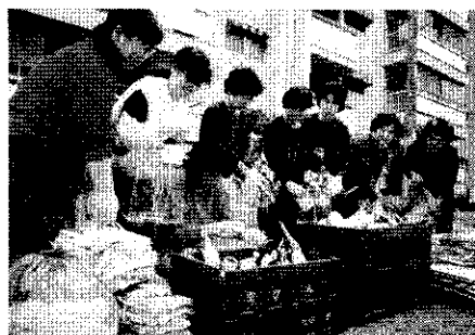
<府民による分別収集>

（注）不燃ごみ、可燃ごみ、資源ごみ、粗大ごみ、その他ごみの5分別を基本に分類。資源ごみを細分類し収集を行っている市町村もある。 （一般廃棄物処理事業実態調査）