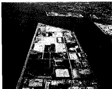
<堺第7-3区埋立処分場>

大阪湾広域臨海環境整備センターを事業主体として、大阪湾圏域の広域処理対象区域(近畿2府4県171市町村)から発生する廃棄物の適正な処理を行う大阪湾圏域広域処理場整備事業(フェニックス事業)を関係府県、市町村等と協力して促進した(2-2-4表)。また、事業の実施にあたり、搬入予定の廃棄物の調査を行った。