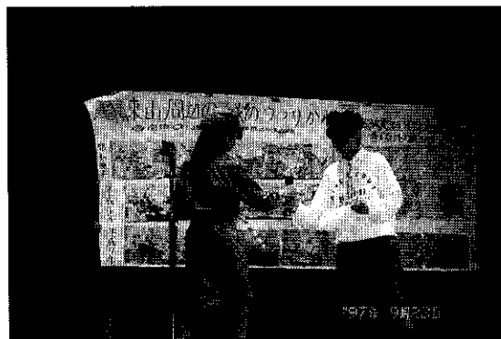
<子ども水環境サミット>

府民に川やそこにすむ生物の観察を通して、水質保全の大切さへの理解と関心を深めてもらうため、市町村主催の水辺の観察会や団体等が実施する啓発事業に対して、資材提供等の支援を行った。また、府民が、自ら川や水辺にでかけ生物観察ができるように、観察の手法と観察ポイントを紹介した改定版「リバー・クエスト（ガイド・マップ編）」を作成した。さらに、次代を担う子どもたちが、身近な水辺の観察活動から感じたことを水環境への提言として発表し、その提言を通して府民に快適な水環境のあり方を考えてもらうため、平成9年9月に「子ども水環境サミット」を開催した。