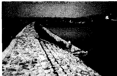
<石川環境整備事業>

芥川、石川、安威川、天野川等において階段護岸や高水敷、遊歩道、桜つつみの整備等の河川環境整備事業を実施した。