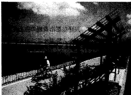
<久米田池（岸和田市）>