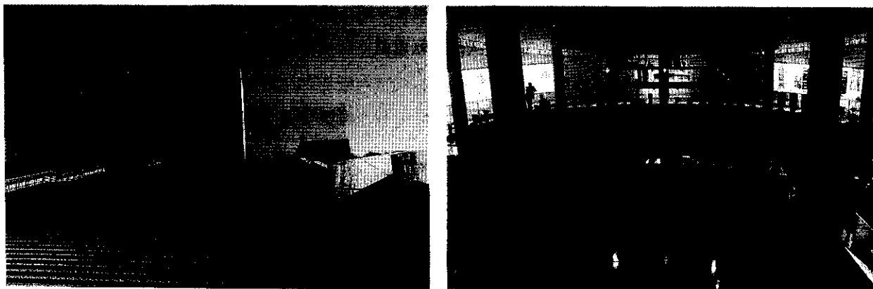
府立近つ飛鳥博物館

近つ飛鳥博物館は、河南町と太子町にまたがる一須賀古墳群の主要部29haを保存し、府民に歴史と文化財に親しむ憩いの場を提供するために昭和61年6月に開園した「近つ飛鳥風土記の丘」に隣接しており、両者を一体的に公開している。これにより歴史文化のストックを生かした街づくりに貢献するとともに、大阪のみならず近畿のアメニティーづくりの一貫として利用されることを目指している。