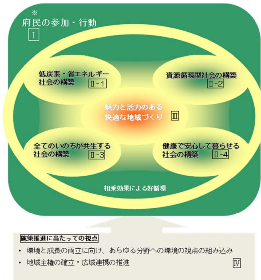
計画に定める各分野の関連についての概念図

また、新計画に基づく進行管理の方法を検討し、新たな方法による計画の進行管理を開始しました。