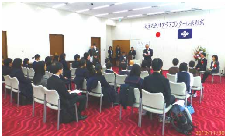
第 54 回(平成 24 年度)大阪府統計グラフコンクール表彰式

11月30日に咲洲庁舎迎賓会議室で、大阪府統計グラフコンクール表彰式を行いました。このコンクールは、統計の表現技術の向上と統計への理解と関心、親しみを深めて頂くことを目的に毎年開催されています。入賞された児童・生徒及び団体賞を受賞された学校に表彰状が授与されました。また、全国コンクール入選者の表彰も併せて行われました。