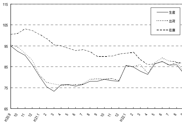
製造工業指数の推移(季節調整済指数平成17年=100)