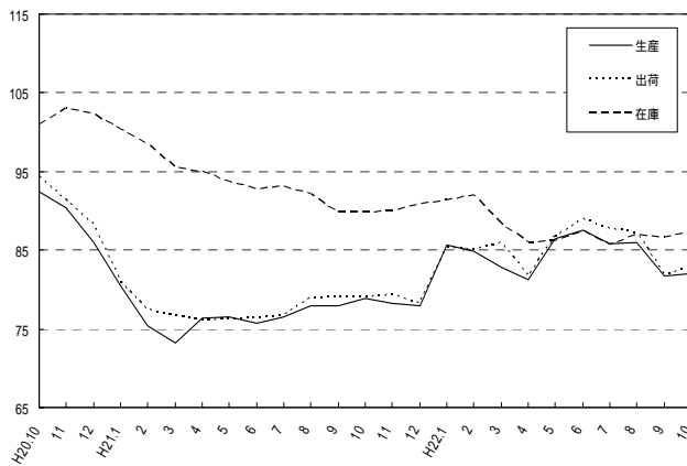
製造工業指数の推移(季節調整済指数平成17年=100)