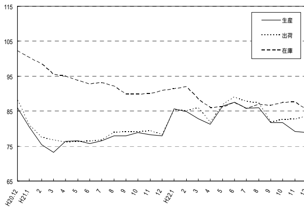
製造工業指数の推移(季節調整済指数平成17年=100)