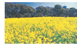
司馬氏の命日(2月12日)は菜の花忌

竹内峠を過ぎると、風情ある家並みが続く竹内集落にいられます。作家・司馬遼太郎氏は、幼いころ、母親の実家のあるこの辺りをよく訪れていました。紀行シリーズ「街道をゆく」の竹内街道の項には「竹内峠の山麓は故郷のようなもの」との記述もあり、この集落に対する氏の想いの深さが伝わります。