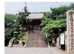
聖徳太子御廟(飯福寺)

司馬氏が「長尾一竹内間のほんの数丁の間は、日本で唯一の国宝に指定さるべき道であろう」と愛した道を楽しみながら歩を進めれば、昔人が目指した飛鳥の地は、もうすぐです。