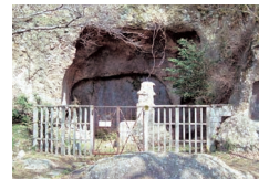
中將姫ゆかりの岩屋峠

※各ページで紹介している歩行距離や標準歩行時間、標準所要時間および電気分岐情報は目安です。