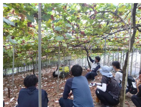
▲ロボットの説明を受ける農業大学校生