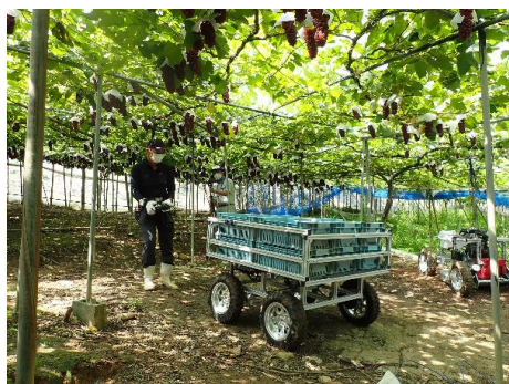
▲運搬用ロボット（ぶどう）

今後も当課ではコンソーシアムへの参加を通じて、ポストコロナに対応した新しい果樹農業のあり方を関係機関とともに追求していきます。