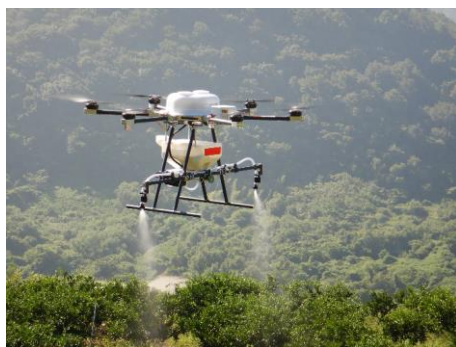
▲農薬散布用ロボット（みかん）