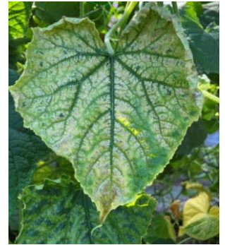
▲きゅうり黄化えそ病を発生したきゅうりの葉

MYSVに感染すると、葉に「えそ斑点」が生じ、やがて葉は黄色～白色になります。症状が進むと生育が抑えられ、収量が大幅に減少し、枯死することもあります。