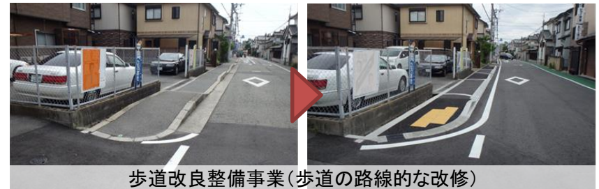
歩道改良整備事業(歩道の路線的な改修)