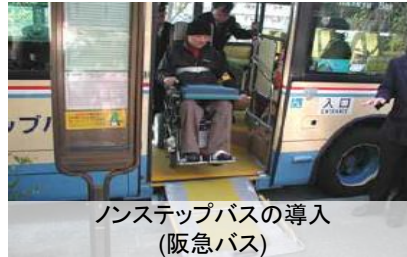
ノンステップバスの導入 (阪急バス)