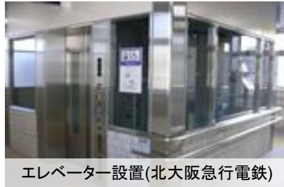
エレベーター設置(北大阪急行電鉄)