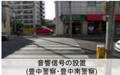
音響信号の設置 (豊中警察・豊中南警察)