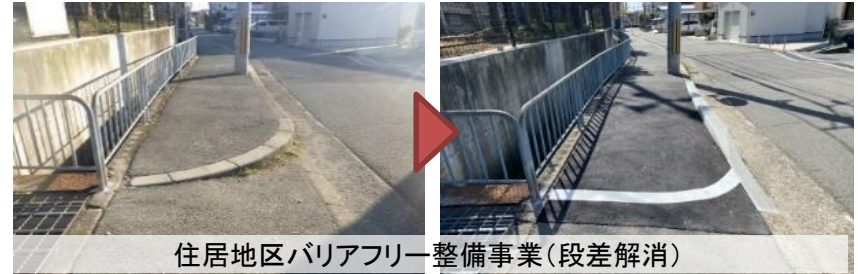
住居地区バリアフリー整備事業(段差解消)