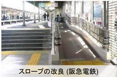
スロープの改良 (阪急電鉄)