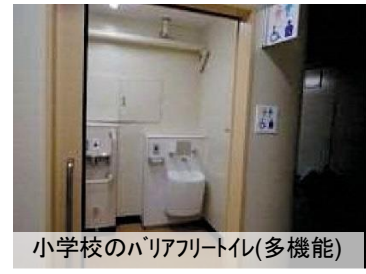
小学校のバリアフリートイレ(多機能)