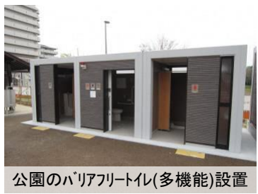
公園のバリアフリートイレ(多機能)設置