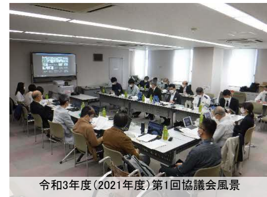
令和3年度(2021年度)第1回協議会風景

新型コロナウイルスの感染拡大状況を考慮しWEB参加と現地参加に分かれて実施しました。