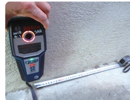
鉄筋調査(鉄筋探査機)