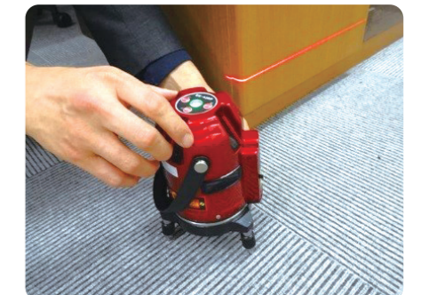
床の傾き調査(レーザー水準器)