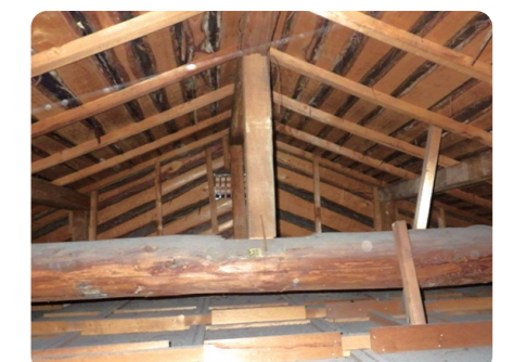
屋根裏調査(点検口から目視)