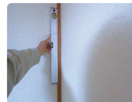
柱の傾き調査(水準器)