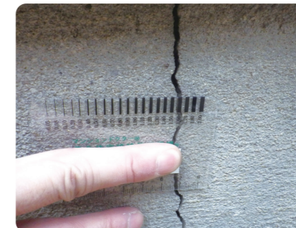
ひび割れ調査(クラックスケール)