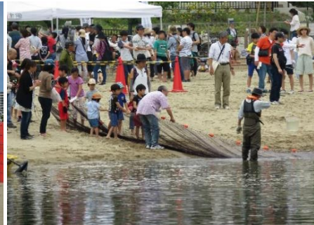
自然観察、環境学習、水辺の安全教室など