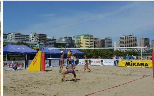
砂遊び、鬼ごっこ、ヨガ、ビーチバレーなど