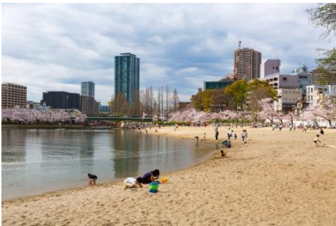
日光浴、散歩、読書、写真撮影など