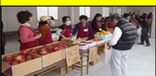
売上の一部は被災地支援に