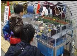
浸水しやすい場所は?