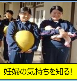
妊婦の気持ちを知る!