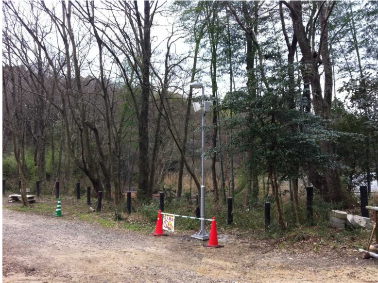
水辺の広場電気設備工事