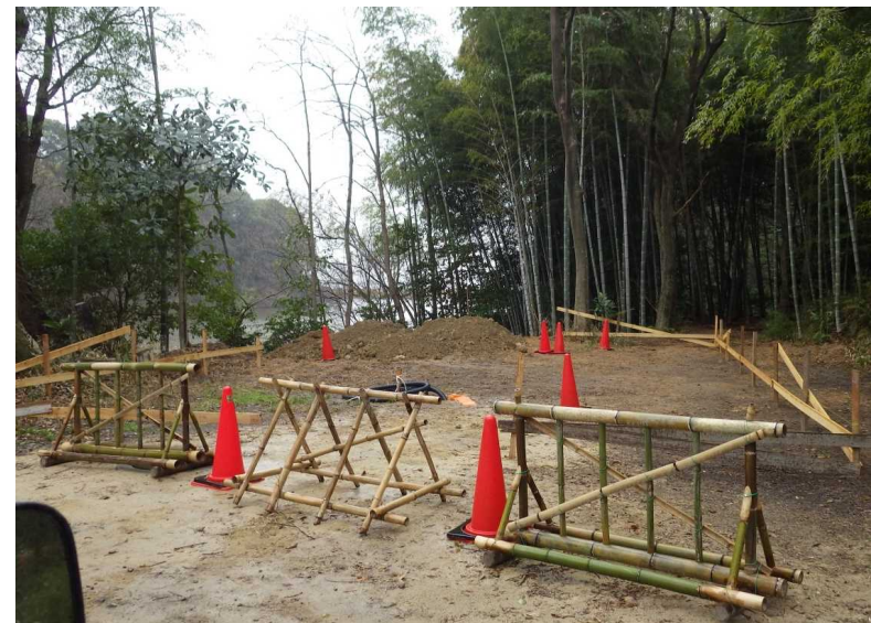
水辺の広場周辺整備工事