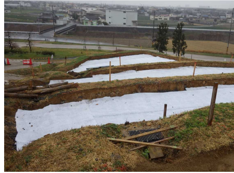
中地区郷の棚田周辺整備工事