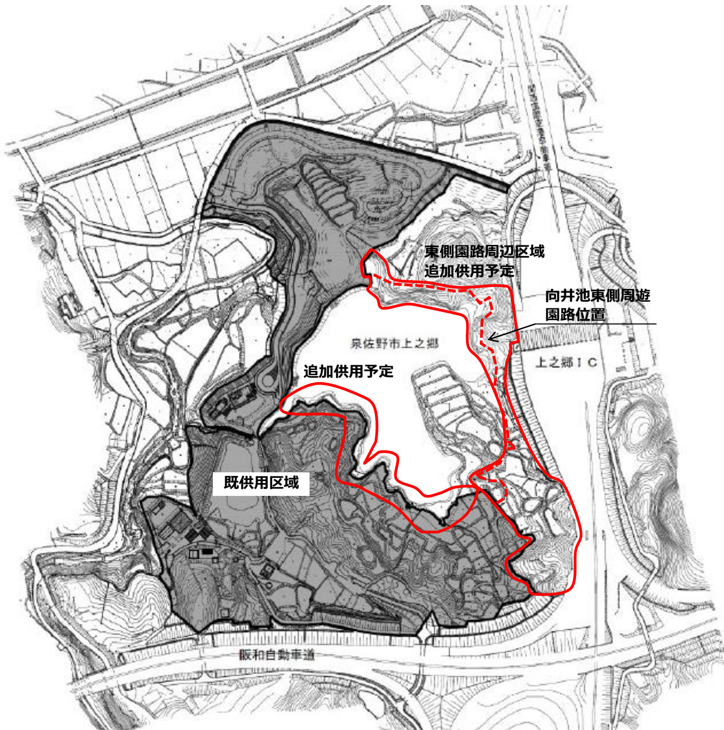
【泉佐野丘陵緑地 供用区域図】 大阪府告示第 1207 号、平成 26 年 8 月 30 日供用開始