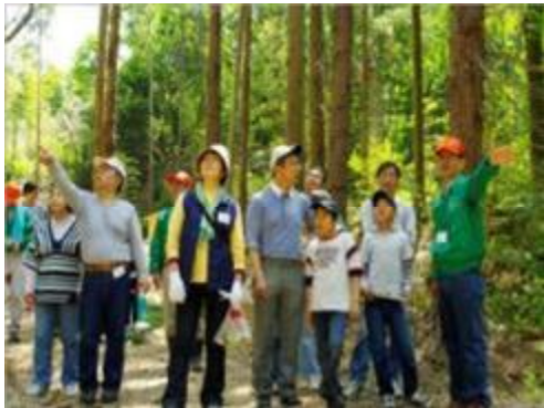
府民、企業等との連携によるみどりづくり（泉佐野丘陵緑地）