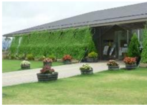
緑化の手本となる大規模公園でのみどりづくり（山田池公園）