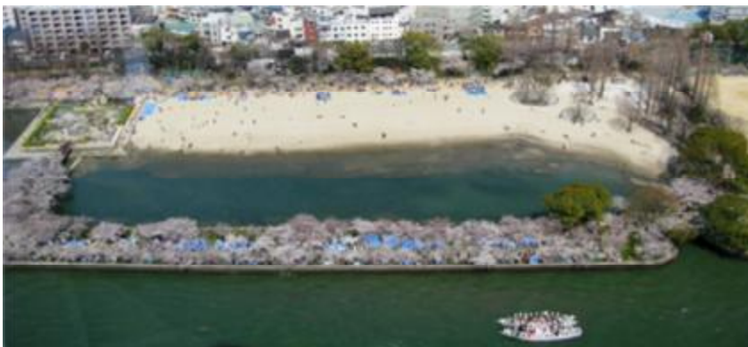
府民の憩いの場となる水辺「大阪ふれあい水辺」（大川）