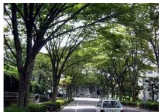
沿道地域との協働による街路樹の再生