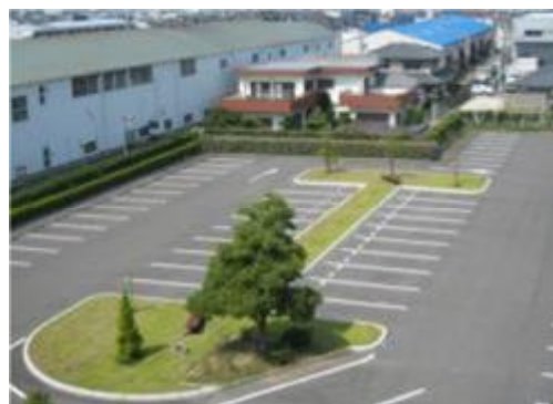
日差しを和らげる緑陰空間の創出