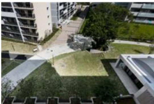
正面エントランスでの緑化