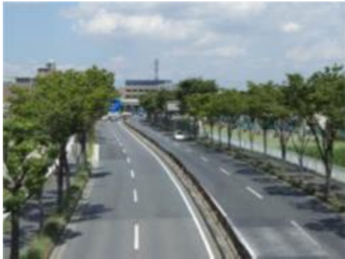
地域に親しまれる街路樹の整備と育成管理整備（国道 170 号）