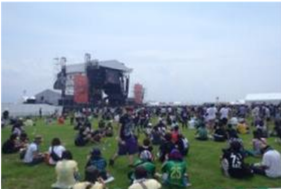
地域のイベントの場となる緑地整備（泉大津フェニックス）