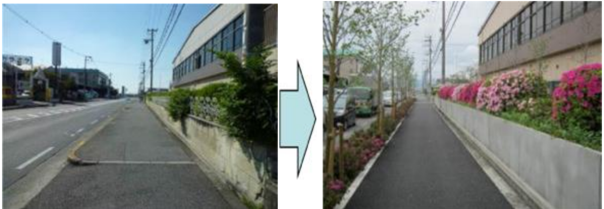
「みどりの風促進区域」内での公民連携によるみどりづくり

また、剪定の工夫や沿道地域の協力を得た街路樹の育成など、樹木植栽にとどまらない様々な手法により、府民が実感できるみどりの創出に努めるものとする。