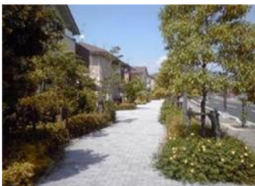
公共用地と民有地の一体化による セミパブリック空間の創出