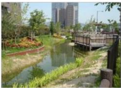
府民の憩いの場となる緑地整備（竜華水みらいセンター）