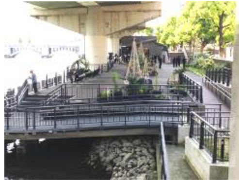
水都大阪における賑わいある水辺とみどりの整備（大川）