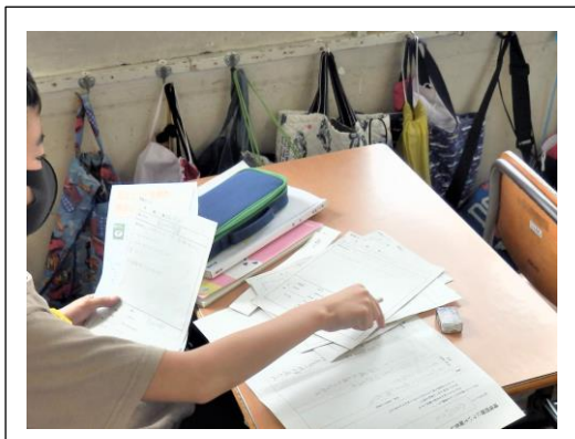
構成を考えている様子