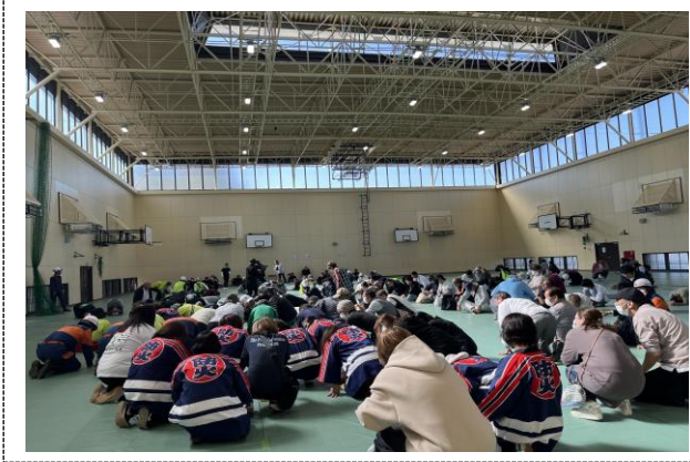
住民避難訓練（和泉市）