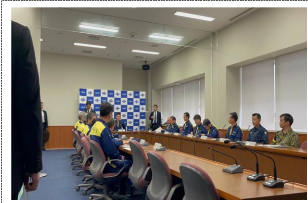
災害対策本部会議運営訓練 （大阪府）