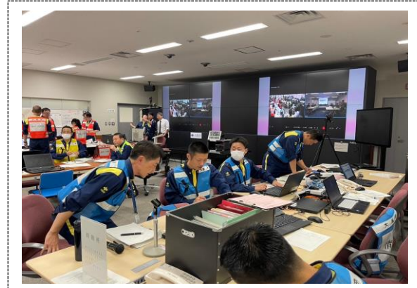
災害対策本部事務局運営訓練 （大阪府）