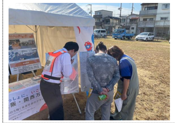
地域防災訓練（和泉市）