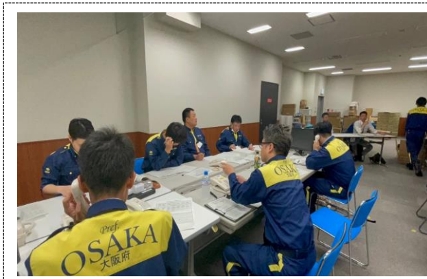
災害対策本部事務局運営訓練 （大阪府）