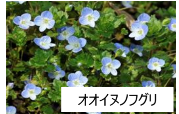
オオイヌノフグリ