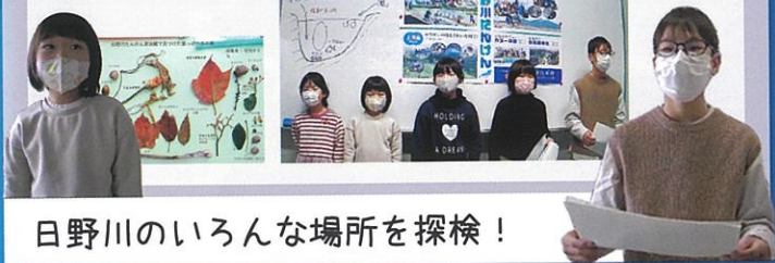
日野川のいろんな場所を探検！

琵琶湖の東、綿貫山を源流とする日野川と支流の佐倉川を、源流、中流、上流と分けて調査、そこに暮らす生きものを調べました。魚、昆虫、野鳥に出会い、落ち葉や木の実などを拾いました。冬の雪と春の雪解け水で、琵琶湖の深呼吸ができて良いと思います。