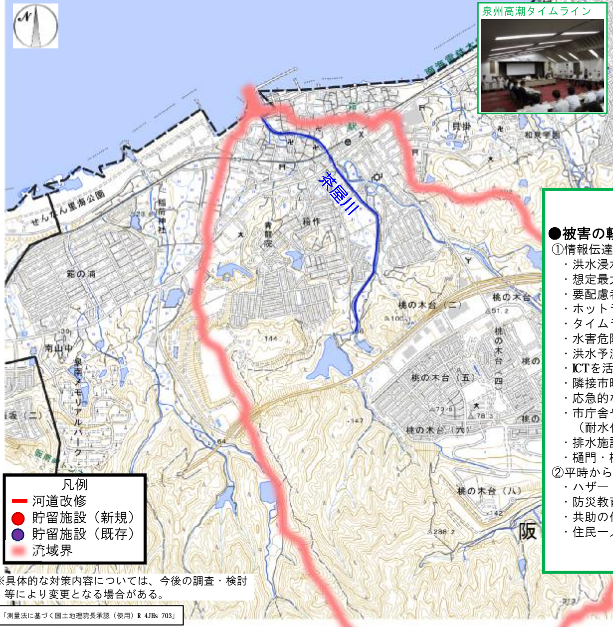
泉州高潮タイムライン

○茶屋川水系では、時間雨量80ミリ程度の降雨を対象とした河道改修が完了している。