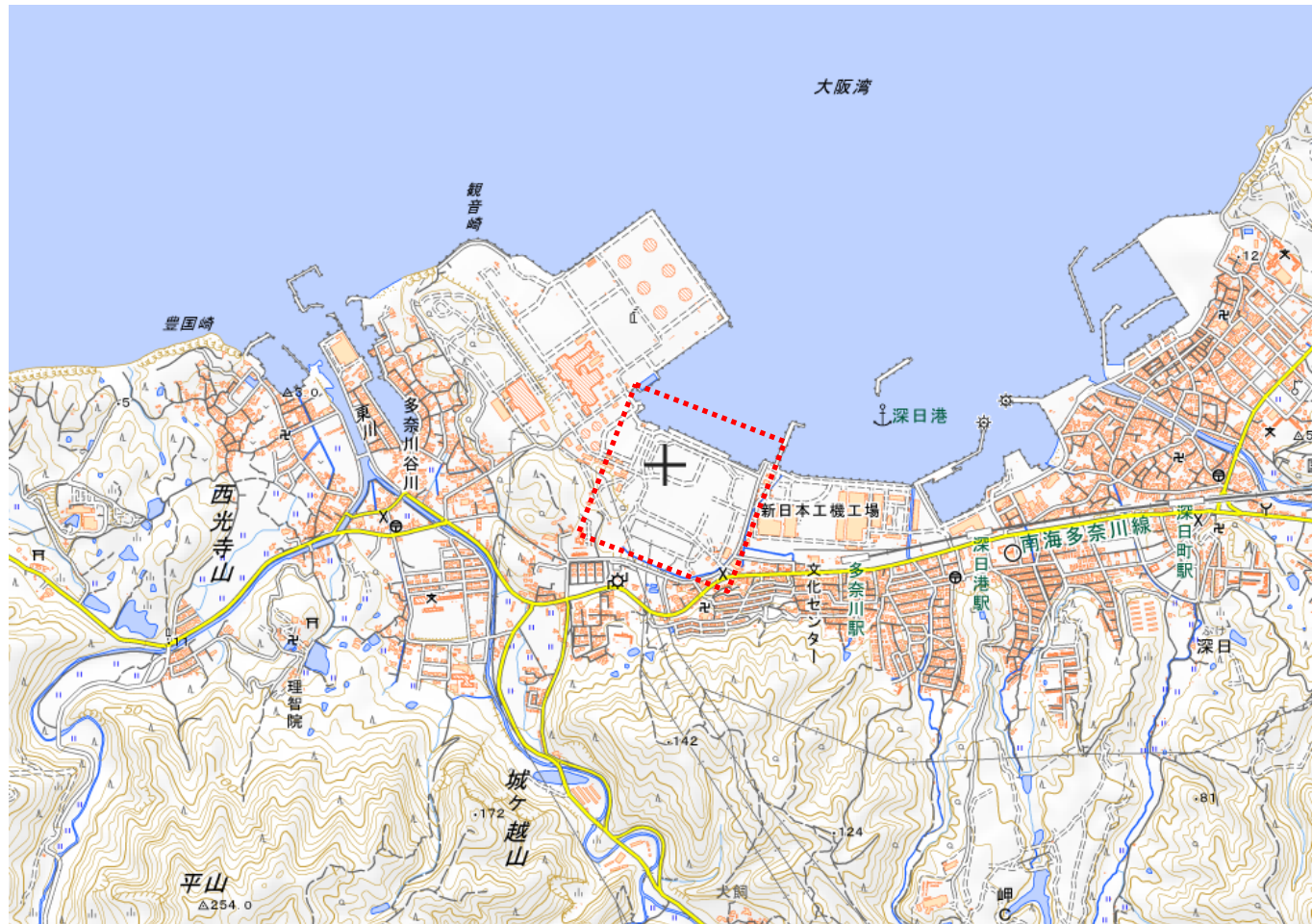
○対象地位置図（岬町多奈川谷川 2539 番 13 の一部）

国土地理院ホームページ ( http://maps.gsi.go.jp ) を基に作成