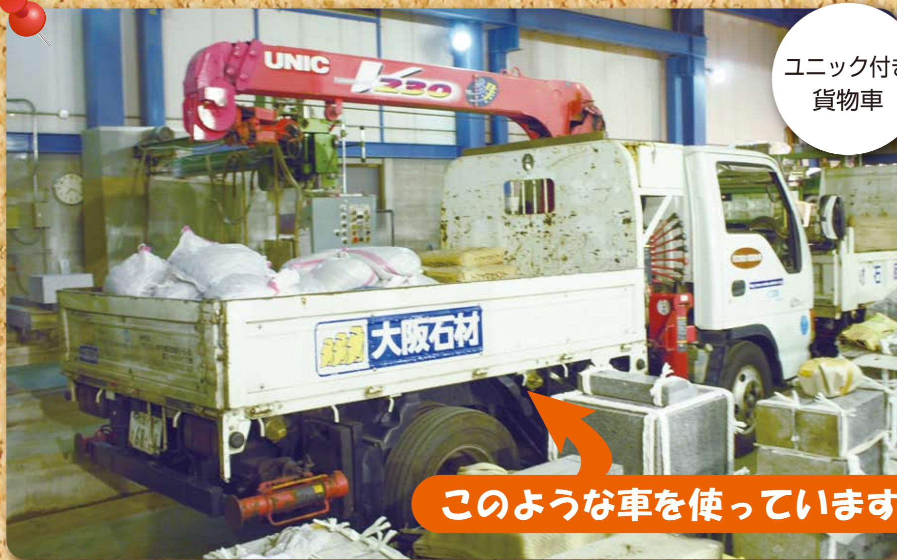
ユニック付き貨物車

このような取組みの結果、平均燃費は平成22年度7.9km/L(貨物)であったものが、平成23年度には8.7km/L(貨物)と向上した。