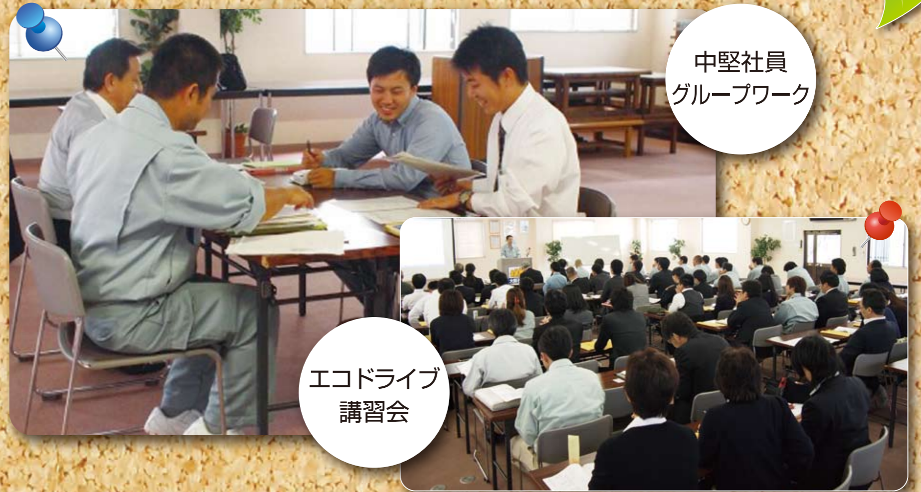
中堅社員グループワーク