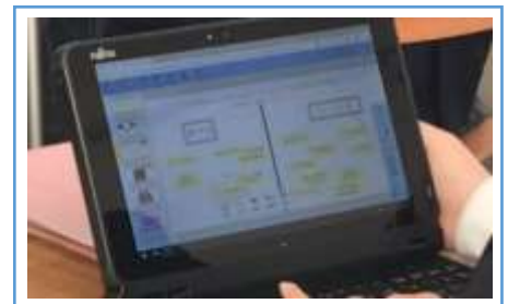
写真3：生徒が意見の比較を行う場面