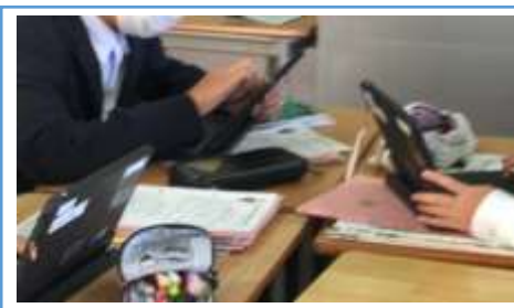
写真2：調べ学習をしている場面