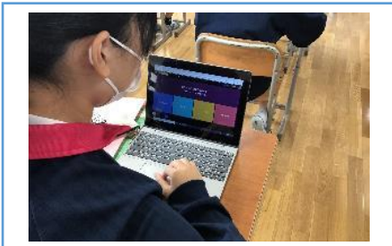
写真 1 : Quizizz で復習をしている様子