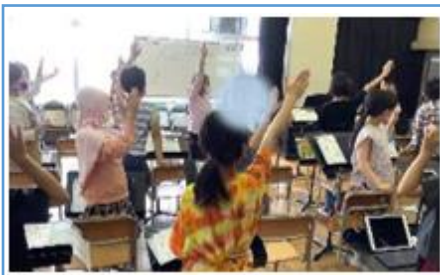
写真1：個人で聴く前に、全員でかけ合いと重なりをチェックしている様子