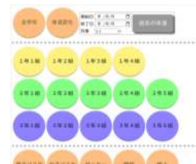
健康観察ポートフォリオサイト