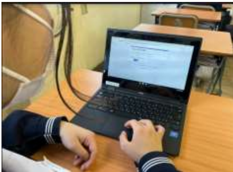
健康状態を入力している様子