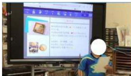
写真2：電子黒板に映し出された資料をもとに、発表をしている場面