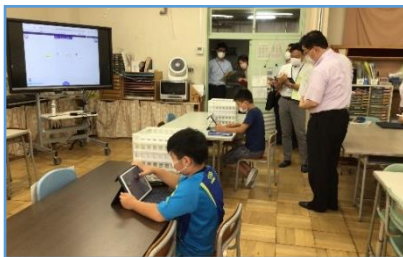
写真1：発表用の資料を提出する前に見直している場面。