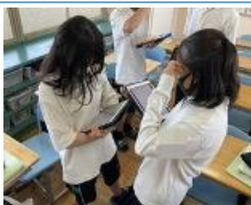
写真1: 計算トレーニングのプリントをiPadで行っている様子。