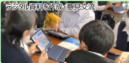
デジタル資料を作成・意見交流