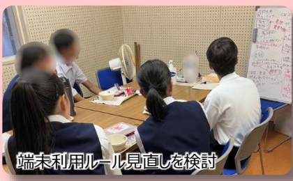
端末利用ルール見直しを検討