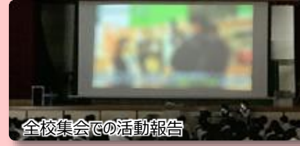
全校集会での活動報告