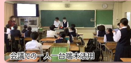
会議での一人一台端末活用