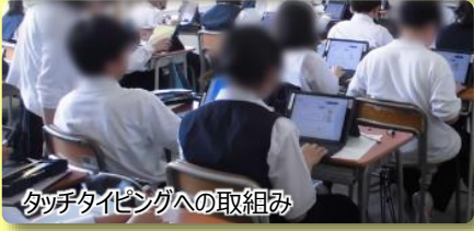
タッチタイピングへの取組み