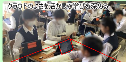
クラウドのよさを活かして学びを深める