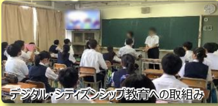
デジタル・シティズンシップ教育への取組み