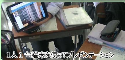
1人1台端末を使ってプレゼンテーション