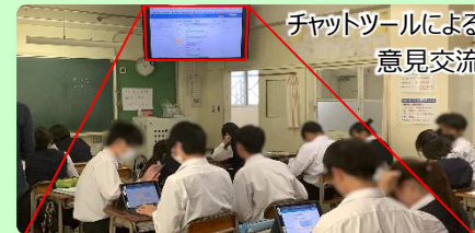
チャットツールによる意見交流