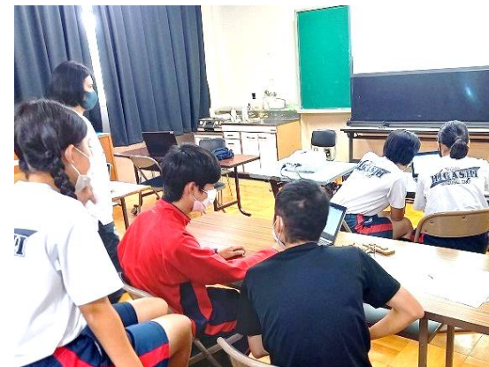
写真2 シーンごとに分かれて作業している様子