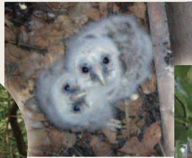
巣箱内のフクロウのひな (H22.4.30撮影)