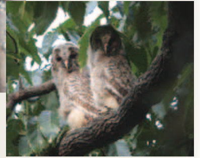
巣箱付近で確認した幼鳥 (H22.5.21撮影)