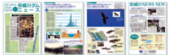
安威川ダムニュースのバックナンバーも閲覧できます。

安威川ダム建設についてホームページを開設・運営しています。ダムの建設内容や環境保全対策について、わかりやすく解説したサイトです。『安威川ダムニュース』のバックナンバー(Vol.8～Vol.15)が閲覧できるページも用意しています。