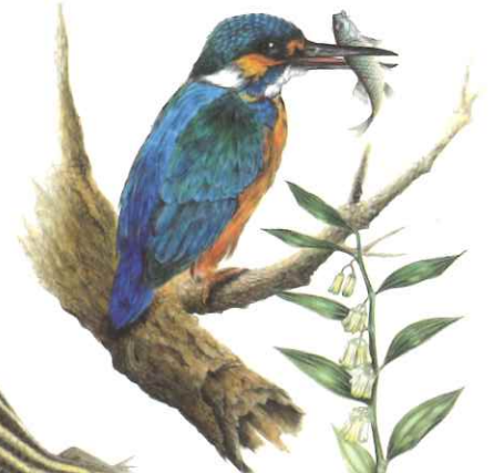
カワセミ 上流でも下流でも魚を 上手につかまえてるよ。