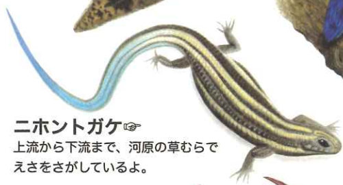
ニホントガケ 上流から下流まで、河原の草むらで えさをさがしているよ。