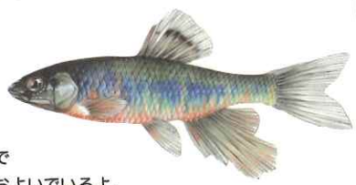
オイカワ 上流から下流まで 流れの速い所でおよいでいるよ。