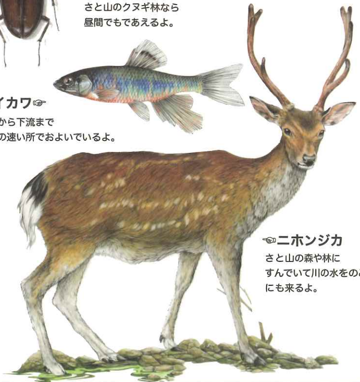
ニホンジカ さと山の森や林に すんでいて川の水をのみ にも来るよ。