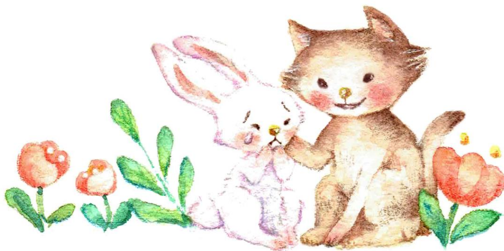
イラスト さんふぁ